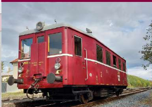
M 131.1443 „Hurvínek“

Vozidlo, ktorým to všetko začalo. „Náš“ Hurvínek bol vyrobený v závode Vagónka Tatra n.p. Studénka v roku 1955 pod výrobným číslom 54106. Ide o zástupcu prvých povojnových motorových vozňov vyrobených v Česko-Slovensku. Z výroby bol dodaný do depa ČSD v Poprade. Pod Tatrami strávil prakticky celý svoj prevádzkový život keď striedal pôsobenie v depách Poprad, Spišská Nová Ves a Prešov. V roku 1983 bol odpredaný pre potreby traťovej dištancie Košice, kde slúžil pracovných vlakov pri údržbe tratí. Po získaní do nášho spolku prešiel v rokoch 2009-2011 rozsiahlovu opravou do prevádzkyschopného stavu. Aj vďaka tomu ho môžete stretávať pri historických jazdách aj po skoro 70 rokoch od vyrobenia.