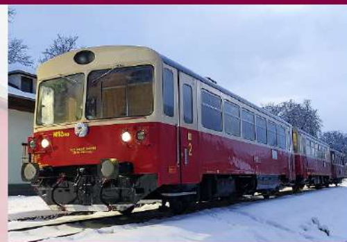
M 152.0160 „Miško“

Vozidlo, ktorým to všetko začalo. „Náš“ Hurvínek bol vyrobený v závode Vagónka Tatra n.p. Studénka v roku 1955 pod výrobným číslom 54106. Ide o zástupcu prvých povojnových motorových vozňov vyrobených v Česko-Slovensku. Z výroby bol dodaný do depa ČSD v Poprade. Pod Tatrami strávil prakticky celý svoj prevádzkový život keď striedal pôsobenie v depách Poprad, Spišská Nová Ves a Prešov. V roku 1983 bol odpredaný pre potreby traťovej dištancie Košice, kde slúžil pracovných vlakov pri údržbe tratí. Po získaní do nášho spolku prešiel v rokoch 2009-2011 rozsiahlovu opravou do prevádzkyschopného stavu. Aj vďaka tomu ho môžete stretávať pri historických jazdách aj po skoro 70 rokoch od vyrobenia.